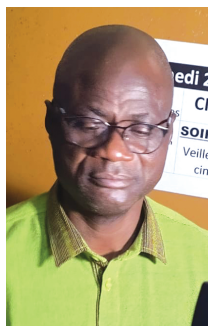
DG du FESPACO: "Souleymane Cissé's work will continue influencing us"

The Pan-African Federation of Filmmakers (FEPACI) has kept to their tradition. Following the official opening ceremony, of the 29th edition of the great celebration of the African cinema and screening of the opening film, Cine Burkina accommodated, on 22 February 2025, a night to pay tribute to the departed filmmakers, particularly a key figure of the African cinema, Souleymane Cissé. Testimony and farewell words from people who worked with the illustrious departed aroused very strong emotions in Cine Burkina theatre as memories recall the qualities of humility, visionary, image-purist, and leadership of the deceased. In his message, Cheick Omar Sissako, Secretary General of the Pan-African Federation of Filmmakers (FEPACI), saluted the memory of a great man. The illustrious deceased has an impressive record: "Baara" in 1979, Gand Prize at Fespaco; "Finyé" in 1982, Tanit d'or at the Carthage Ci-