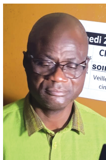
DG du FESPACO : « les œuvres de Souleymane Cissé continueront de nous influencer ».

La Fédération panafricaine des cinéastes (FEPACI) consacre à sa tradition. A l'issue du clap marquant l'ouverture officielle de la 29 e édition de la grande messe du cinéma africain, suivi de la projection du film inaugural, le Ciné Burkina a abrité, le samedi 22 février 2025, la soirée d'hommage aux cinéastes disparus, notamment à une figure de proue du cinéma africain, Souleymane Cissé. Des textes de témoignage et d'adieu des collaborateurs à l'illustre disparu ont suscité des émotions les plus fortes dans la salle du ciné Burkina, tant les souvenirs rappellent les qualités d'humilité, de visionnaire, de puriste d'image, d'éclaircisseur et de leadership du défunt. Le secrétaire général de la Fédération panafricaine des cinéastes (FEPACI), Cheick Omar Sissoko, dans son message a salué la mémoire d'un grand homme. L'illustre disparu avait un palmarès impressionnant "Baara en 1979 étalon d'or de Yennenga au FESPACO - Finyé en 1982 Tanit d'or aux JCC 1983 puis