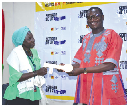
At the launch of the Critics' Week, Minister of Communication, Culture, Arts and Tourism Pingdwendé Gilbert Ouédraogo (right) handing over the key to the headquarters of the African Federation of Film Critics

There we go with the first edition of the Critics' Week taking place on the theme "Critic, a tool for promoting African cinema". According to the President of Burkina Association of Film Critics (ASCRI-B), Abraham Bayili, this week aims to reaffirm the central place of film critic at FESPACO, while enhancing its role as an intermediary between films and audience. Throughout the week, focus will be on giving greater visibility to film critic, proposing an original selection of films from Africa and Diaspora, creating a space for meeting and discussions between film professionals, critics and audience, and celebrating innovation and excellence in film by awarding the "Clément Tapsoba" Prize in tribute to one of ASCRI-B founding members. The week will thus be punctuated by film screenings, especially 10 feature films (5 fictions and 5 documentaries), two panels, a master class, fora debates and the dedication of the book "Idrissa Ouédraogo, le Maestro du cinéma