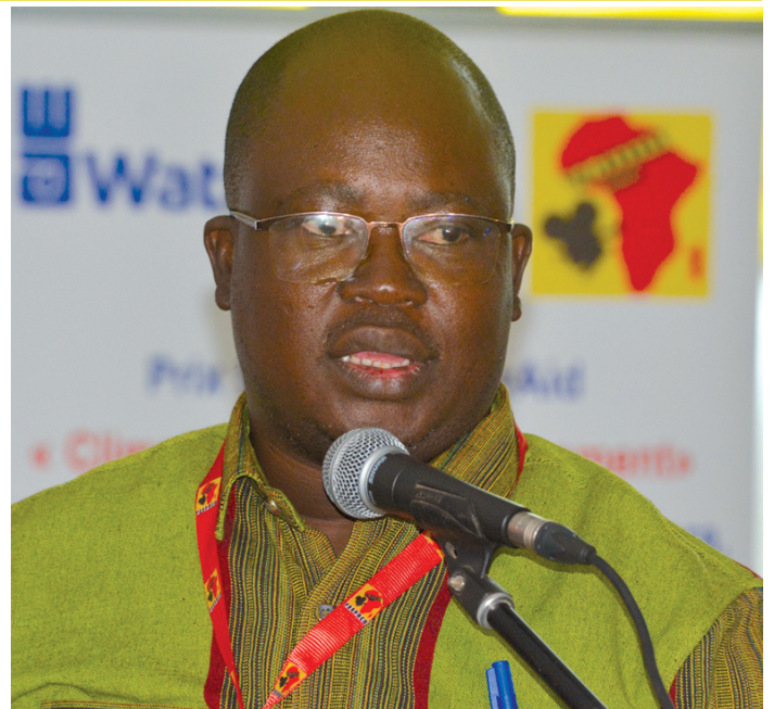
President of FESPACO 2025 National Organizing Committee Bètamou Aymar Fidèle Tamini: « Filmmakers should keep in mind that attending this grand film festival is in itself a victory ... ».

Each FESPACO edition is an opportunity to award special prizes. This year's edition prizes were presented to the media during a press conference led by the President of FESPACO 2025 National Organizing Committee, Bètamou Aymar Fidèle Tamini. In all 22 prizes worth CFA F 97 million will be given in three distinct categories by 19 donors. A tradition at each FESPACO edition, these prizes according to Bètamou Aymar Fidèle Tamini are of capital importance in the eyes of filmmakers in competition. Special prizes are also a significant contribution testifying of the unwavering commitment of partners to a rising African cinema. He expressed his "profound" gratitude to the "generous" donors supporting the celebration of the African 7th Art. Though their support, Mr Tamini said, they contribute to the rise of an authentically African cinema, true to our identities, carrying stories that resemble us and hold us together. "The National Organizing Committee is delighted at the steady and unwavering support of partners to Burkina Faso and the African continent. As they put it so well, hard times reveal true friends. May this strong sign of brotherhood strengthen further our bonds", he stated. Mr. Tamini also commended the media, whose presence and commitment are "invaluable" support to making this event successful. He wished the best to all filmmakers in competition. At FESPACO 2023, 19 special prizes from 15 donors were registered.