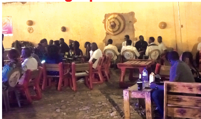
The Idrissa Ouédraogo Space welcomes its first customers with an artistic performance.

As part of the 29th FESPACO Edition a relaxation area for festival-goers and show biz people was created and named "Espace Idrissa Ouédraogo". Located next to Pacific hotel, the space opened its doors on Saturday 22 February, 2025. On the first opening night, the first guests are entitled to artistic performances, talk and connect and barbecue areas. Coming in groups of friends, in pairs or alone, the festival-goers have a good time of show, business networking until early morning. As a reminder, the Idrissa Ouédraogo Space opens from 4pm to 5am throughout the festival week and entrance is free.