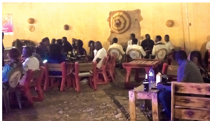
L'espace Idrissa-Ouédraogo accueille ses premiers clients sous une performance artistique.