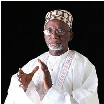
Souleymane Cissé sera certainement au centre des échanges lors de la veillée d'hommage aux cinéastes disparus de ce FESPACO 2025 au Ciné Burkina.