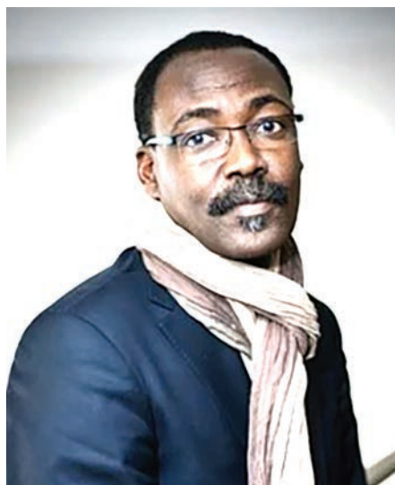
Mahamat Saleh Haroun, one of the great directors of Chad.