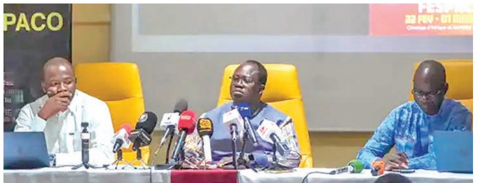
The Official Selection of FESPACO 2025 was unveiled in N'Djamena, capital of Chad.

The Pan-African Film and Television Festival of Ouagadougou (FESPACO) begins this Saturday 22 February to 01 March 2025 with «African Cinema and Cultural Identities» as edition theme. After Mali in 2023, it is now Chad's turn to be identified as guest of honour for FESPACO. In a sub-regional context marked by insecurity fought vigorously by countries of the Alliance of Sahel States (AES), Burkina Faso, Mali and Niger, this choice is no accident at all. Indeed, Burkina Faso and the Republic of Chad share the same challenges that could be addressed through cinema to find common and lasting solutions against terrorism in the Sahel. But, Chad also has a long tradition of cinema since the country's independence with actors such as Edouard Saily, Mahamat Saleh Haroun and Issa Serge Coelo,