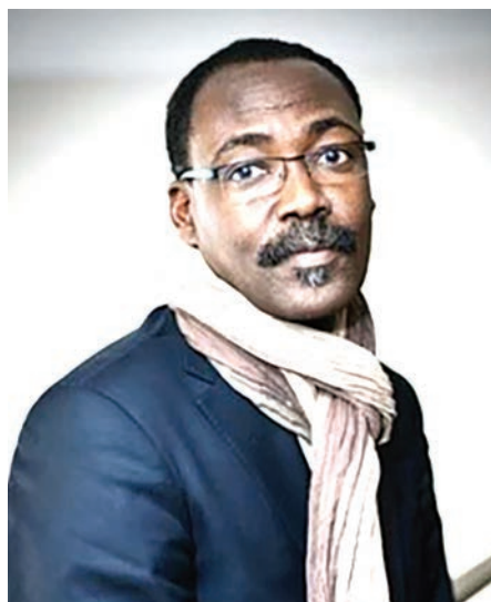
Mahamat Saleh Haroun est l'un des grands réalisateurs du Tchad.